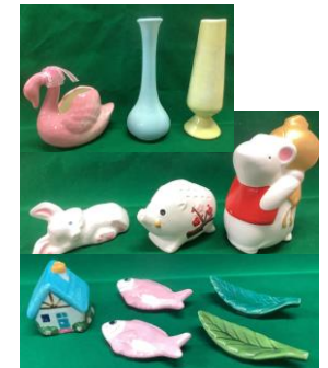
花びん、干支の置物等 300円~

※写真は一例です。商品は在庫状況により、 色やデザインが写真と異なる場合があります。